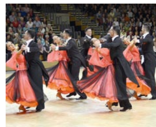
TANZEN Region in Bewegung