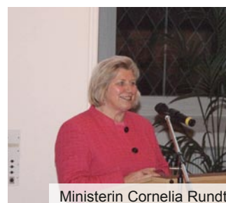
Ministerin Cornelia Rundt

nische und pharmazeutische Industrie gemeinsam zu einem Treiber der Innovation wurden. Niedersachsens Sozial- und Gesundheitsministerin Cornelia Rundt sprach über das Projekt „Gesundheitsregionen Niedersachsen“, das ab 2014 durch eine gezielte Förderung alle Akteure aus dem Gesundheitsbereich zusammenbringen und in die Lage versetzen soll, passende Angebote auf regional vorhandene Herausforderungen zu entwickeln. „Mir ist wichtig, dass Lösungen aus der Region für die Region entwickelt werden“, sagte Rundt. ■