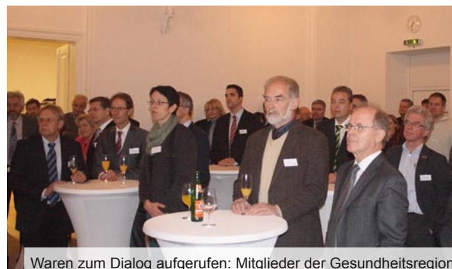
Waren zum Dialog aufgerufen: Mitglieder der Gesundheitsregion